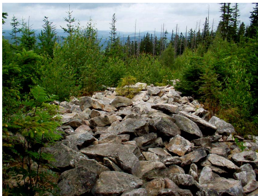
2) val přehradí