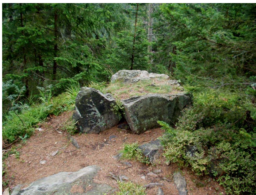
6) kamenný stůl v jižní části akropole