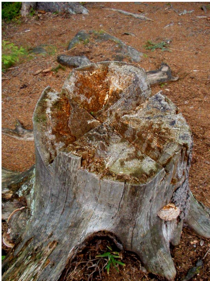
7) detail kříže na pařezu