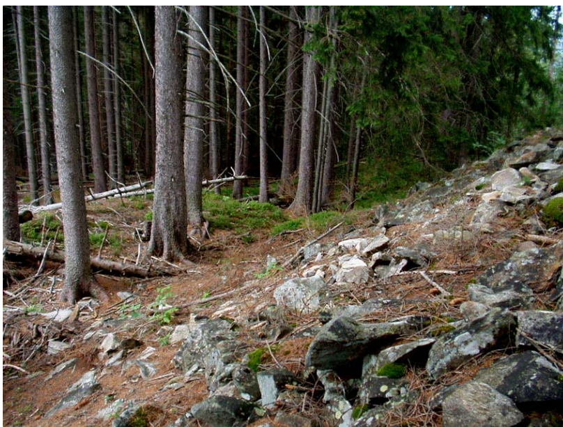
3) dvojité vnitřní val okolo akropole