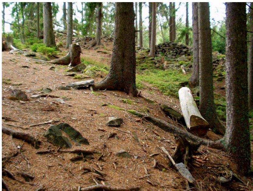
5) prostor akropole