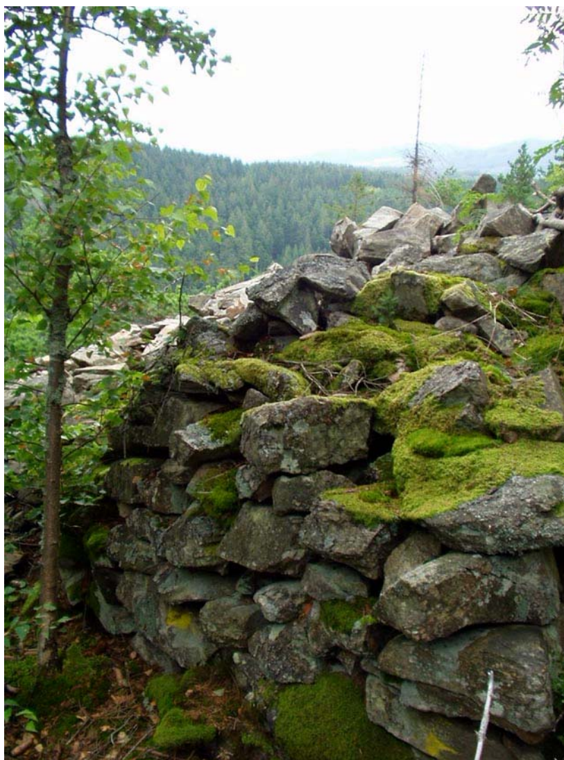
4) detail zdiva vnitřního valu